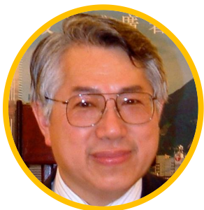
AI KWOK Chairman, GBA