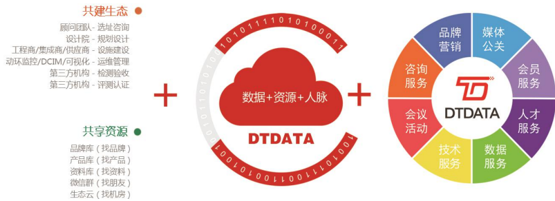
DTDATA媒体支持&生态合作伙伴(部分)

DTDATA邀请业内知名的互联网企业、数据中心业主、服务商、供应商成为DTDATA生态合作伙伴，依托DTDATA媒体与服务平台，以开放、共享、极具价值的理念，传播正能量，服务品牌与市场，打造良性的生态系统，共同推进绿色数据中心发展与创新应用！